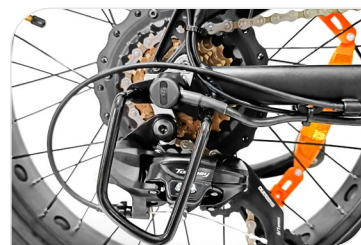
Cambio Shimano 7 velocità