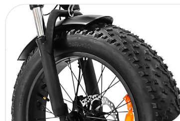
Ruota FAT all-road