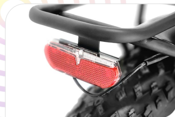
Luce posteriore alimentata con funzione stop