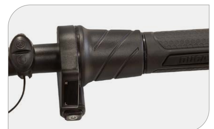
3 modalità di guida