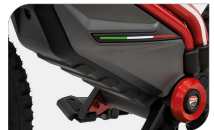
Batteria da 125 Wh, fino a 12 km di autonomia