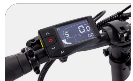
Display LCD Platium