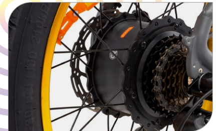
Motore posteriore 48 V, 250 W, 55Nm