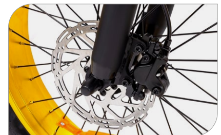
Freni a disco idraulico anteriore e posteriore