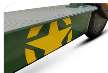
Battery 36 V, 7.8 Ah, 281 Wh with BMS smart