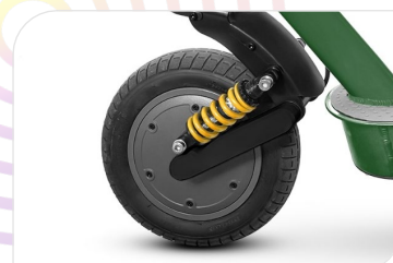
Brushless motor 350 W, 15 Nm, KERS, Peak Power 900 W