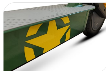
Batterie 36 V, 7.8 Ah, 281 Wh avec BMS intelligent