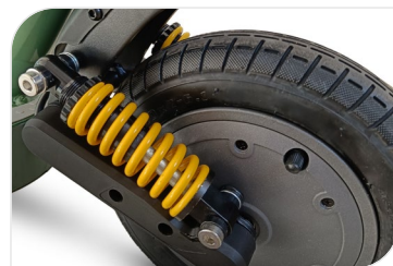
Suspensions à ressort à l'avant et à l'arrière