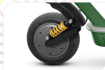
Motore Brushless 350 W, 15 Nm, KERS, Peak Power 900 W