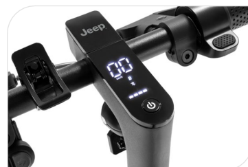
Display a LED integrato, cruise control