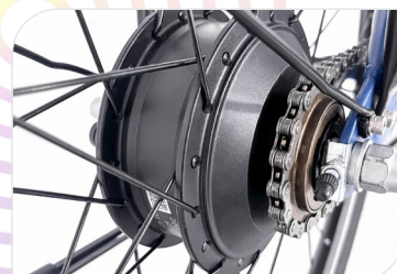
Motore Sutto Bafang, 250 W, 35 Nm