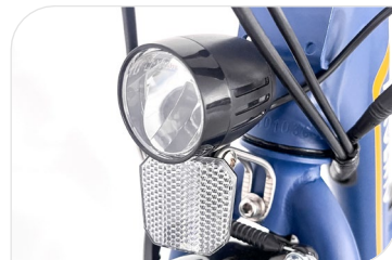
Feux avant et arrière connectés