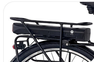
Greenway battery 36 V, 7.8 Ah, 281 Wh, smart BMS