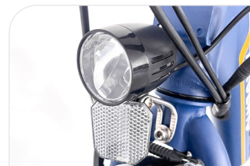
Connected front and rear lights