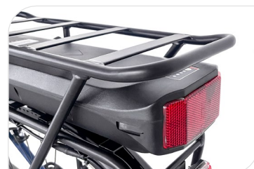
Integrated rear rack