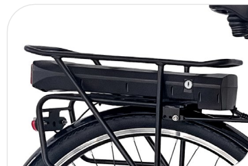
Batterie Greenway 36 V, 7.8 Ah, 281 Wh, BMS intelligent