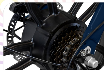
Motore Sutto Bafang, 250 W, 48 V, 70 Nm