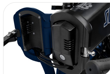
Batterie Greenway 48 V, 10.4 Ah, 500 Wh, BMS intelligent, cellules LG