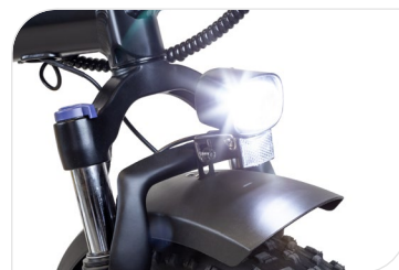
Luci frontale e posteriori integrate