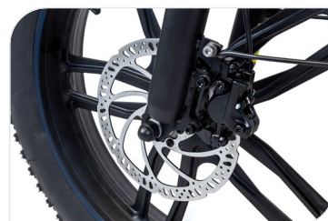
Freni a disco idraulici con cut off