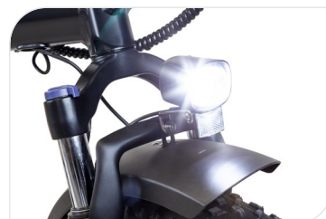
Integrated front and rear lights