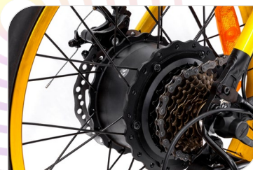
Motore Sutto Bafang, 250 W, 55 Nm