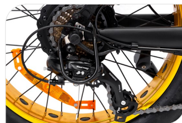
Cambio Shimano Tourney 7-velocità