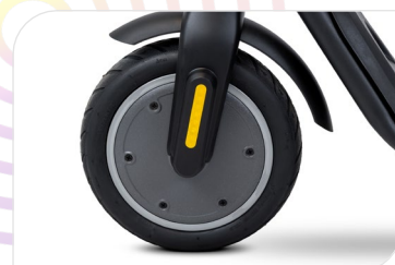
Motore Brushless 250W, 14,5 Nm, KERS, Peak power 500W