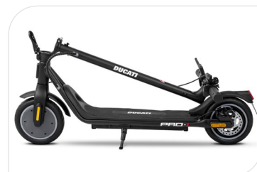
Légère et compacte, seulement 13 kg