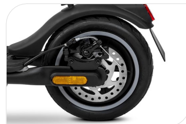
Frein électrique à l'avant et frein à disque à l'arrière, deux leviers de frein