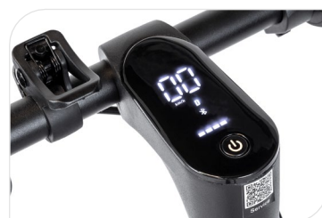
Integrated LED display with cruise control