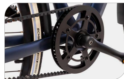
Trasmissione a cinghia