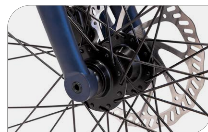
Ruote anteriore con perno passante