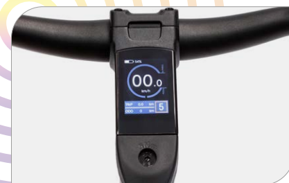
Display integrato e cavi a scomparsa