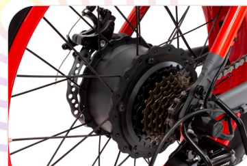
Motore Sutto Bafang, 250 W, 55 Nm