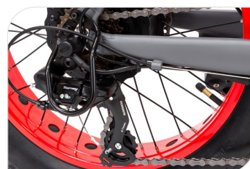
Cambio Shimano Tourney 7-velocità